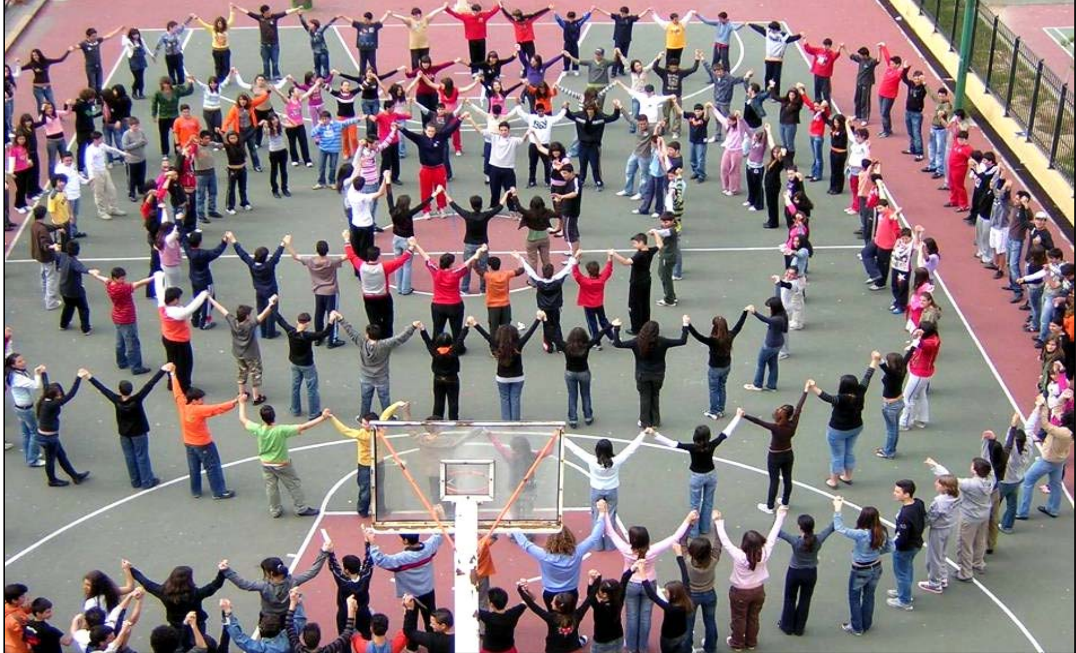
2 ο Γυμνάσιο Αγ. Βαρβάρας - Αθήνα Το σύνολο των μαθητών του σχολείου (273 μαθητές) συμμετείχαν στη δημιουργία μιας μεγάλης ανθρώπινης αλυσίδας!