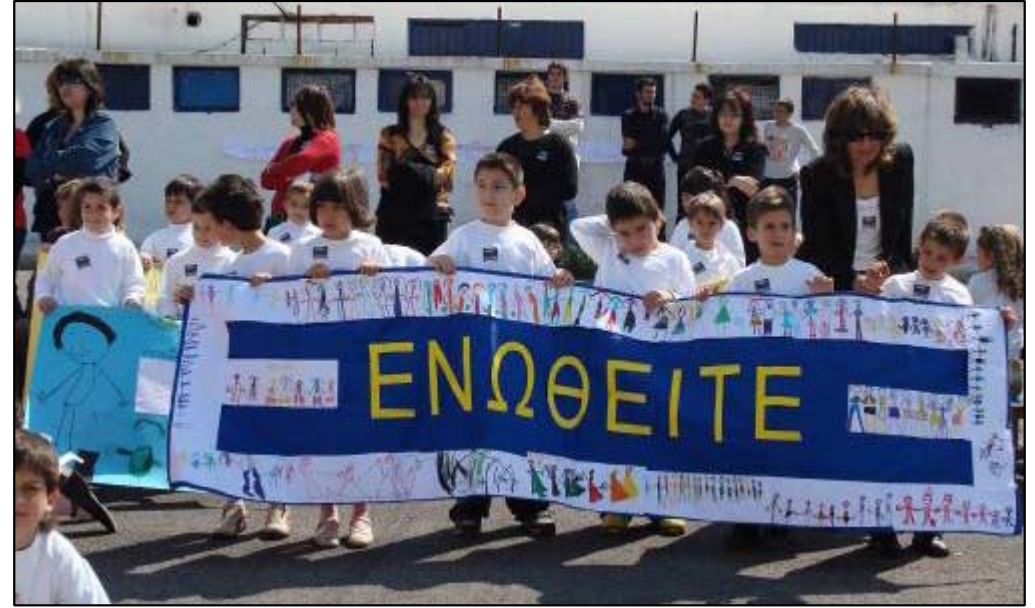
Σχολεία Καναλιών - Καρλας Βόλου