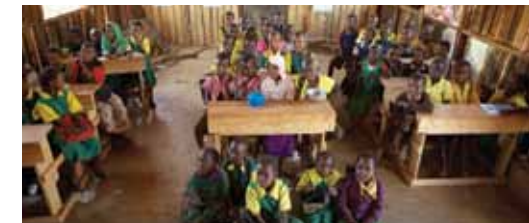
Κατάμεστη αίθουσα στο δημοτικό σχολείο του Emengan, Isiolo, Κένυα.

θα μπορούσαν να αγοράσουν 70 θρανία για δύο σχολεία.